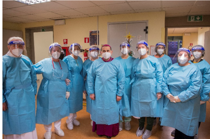
L'Arcivescovo Mario Delpini visita e benedice i pazienti e il personale sanitario dell'Hospice del Pio Albergo Trivulzio