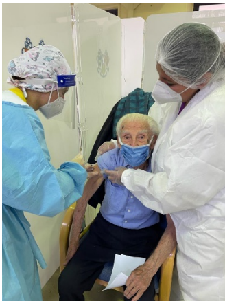
Un ospite eccezionale al Centro Vaccinale del Trivulzio. G.M. di anni 105.

N.B. indicazioni per la lettura: i contenuti inediti ed oggetto di prima pubblicazione, di integrazione o di aggiornamento sono contraddistinti con la seguente icona: 📄