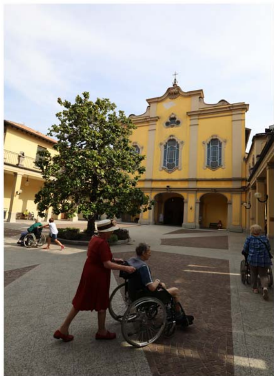
Facciata della Chiesa "Immacolata Concezione e chiostro che si affacciano sulla Piazzetta "Schuster)

Dopo essere stato completato, l'edificio è stato in parte rinnovato e adeguato alle nuove esigenze assistenziali, mediche e gestionali.